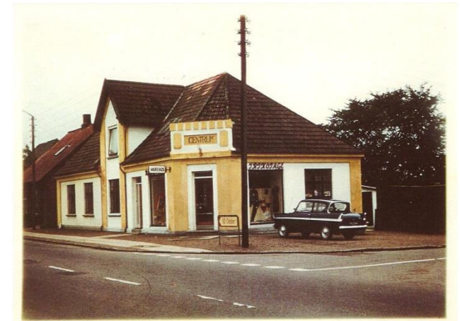
Trikotageforretning Centrum Beder Landevej 68 ca. 1970. Nr. 70 til venstre var fodermesterboligen til Kristiansgården.

Turen kan printes ud fra hjemmesiden. www.bedermallingarkiv.dk