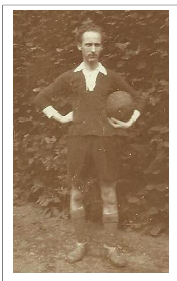
Vilhelm ca. 1929