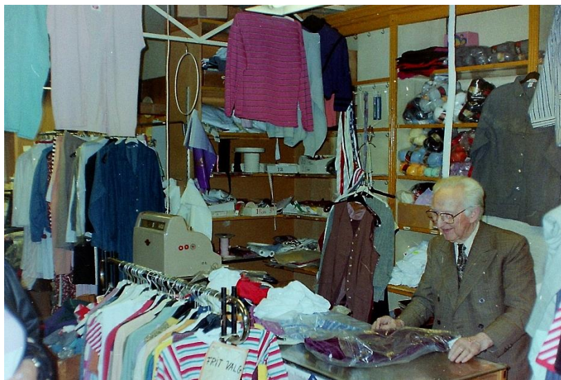
Sidste dag – juni 1999. Forretningen blev åbnet i 1945, altså i drift i 54 år.