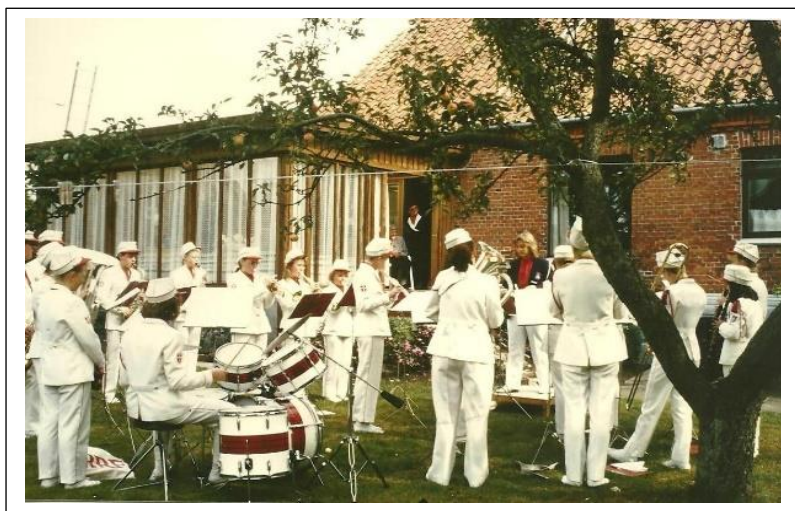
Aarhus Pigeband ved Guldbrylluppet