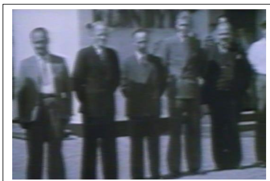
Foto fra Egnfilmen 1950